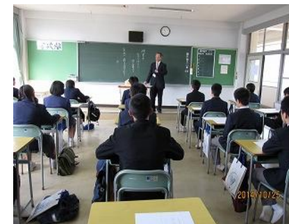
特進コースのグローバルスタディ。 英語を用いた、おもしろい授業でした。