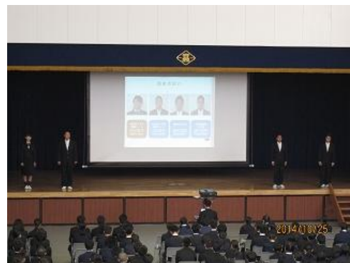
普通科の特進コース、進学コース 機械科・電気情報科から1名ずつ 計4名の呉港生が、とてもわかりやすく 学校紹介をしてくれました。