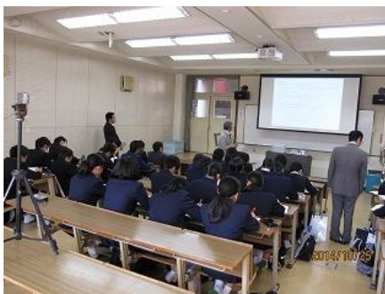
出てくる答えに子ども達の反応も 'おおおおお〜'と歓声があがり、 楽しそうに問題を解いていた姿が 印象的でした。