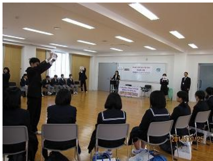
川柳を用いた、国語の授業。 まるで、テレビ番組のペケ×ポンのようでした。

その後は、2回の体験授業が行われました。 特進コースのグローバルスタディ、進学コースの数学、国語、英語、 地歴公民、理科。機械科・電気情報科のロボコン、ソーラーカーに 電気自動車、CADなど盛りだくさんの体験授業でした。