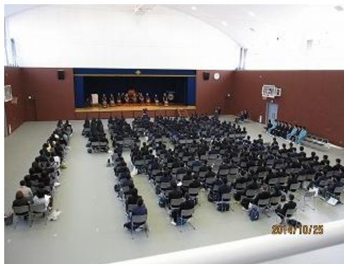
ブラスバンド部の武田節、和太鼓演奏から始まった開校式。

10月25日(土)第2回オープンスクールが開催されました。前はクラブ体験、特進コース体験でしたが、今回は普通科・機械科・電気情報科の体験授業という形で、たくさんの中학생さんと保護者の方々にお越しいただきました。わが子が入学してしまうと、オープンスクールに参加する機会がなくなります。ですが、今回はとても魅力的な体験授業を見ることが出来たので、呉港の良さを在校生の保護者の方々にも知ってもらいたいと思い、じっくりと報告します。