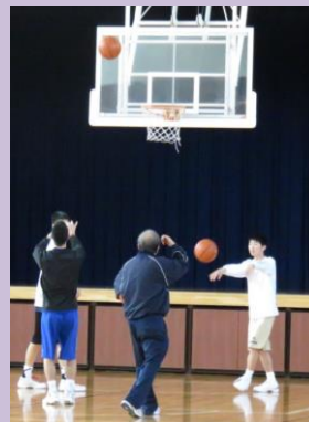
朝練にもお邪魔してきました。先生からアドバイスを受けながらシュートの練習をしていました。