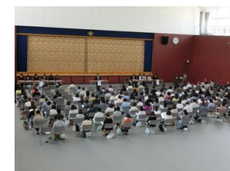
盛谷新会長挨拶 これより新体制スタート