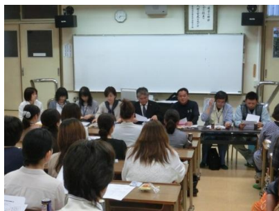
執行部より会議の流れを説明

6月13日(金)教育後援会 常任委員会において、クラス役員(育成・生活・広報) 初顔合わせが行われました。