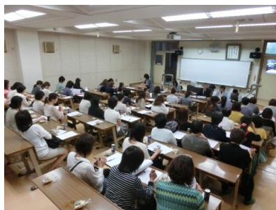
今年度のクラス役員のみなさん